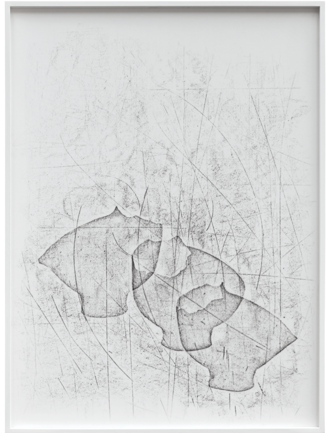
6 Installationsansicht | Installation view 7 Scherben | Shards , 2022 Graphit auf Papier | Graphite on paper 95x70cm