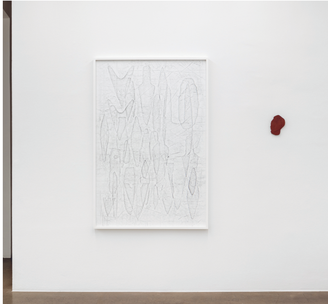
14 Installationsansicht | Installation view 15 Neolithische Äxte | Neolithic Axes, 2022 Graphit auf Papier | Graphite on paper 150x100cm