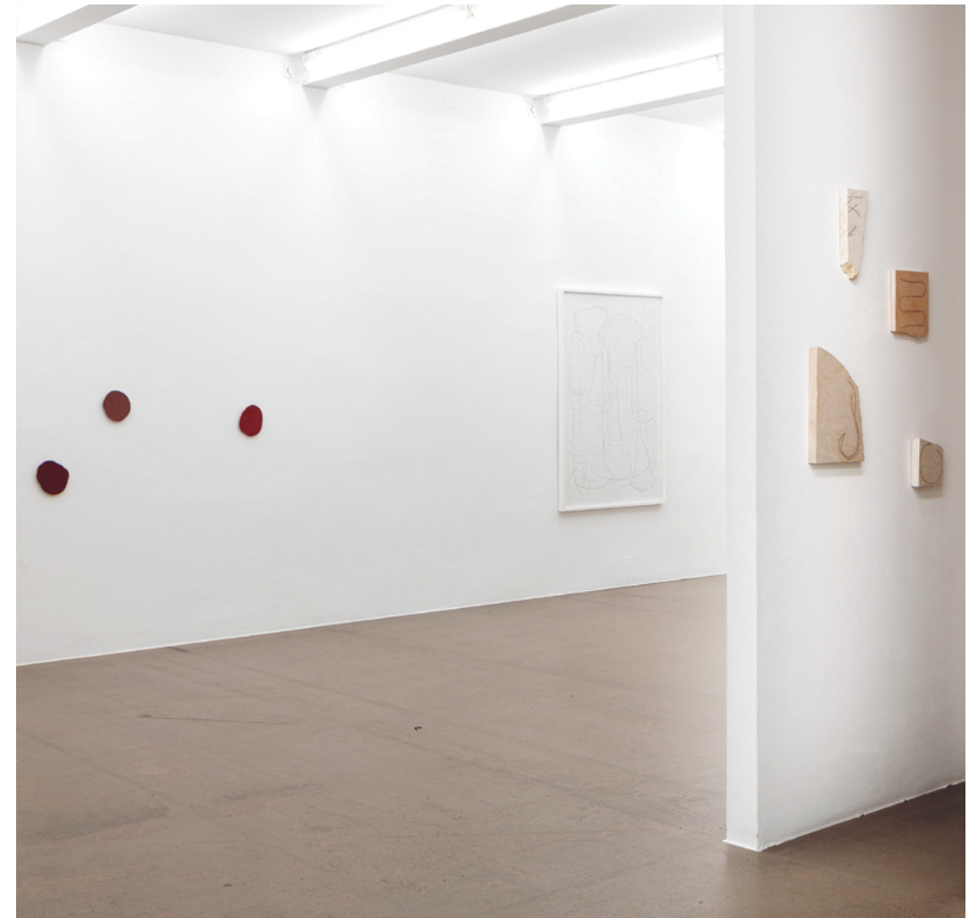
12 Musterstücke, 2021 Kalkstein und Ölfarbe | Limestone and oil paint verschiedene Größen | various sizes 13 Installationsansicht | Installation view