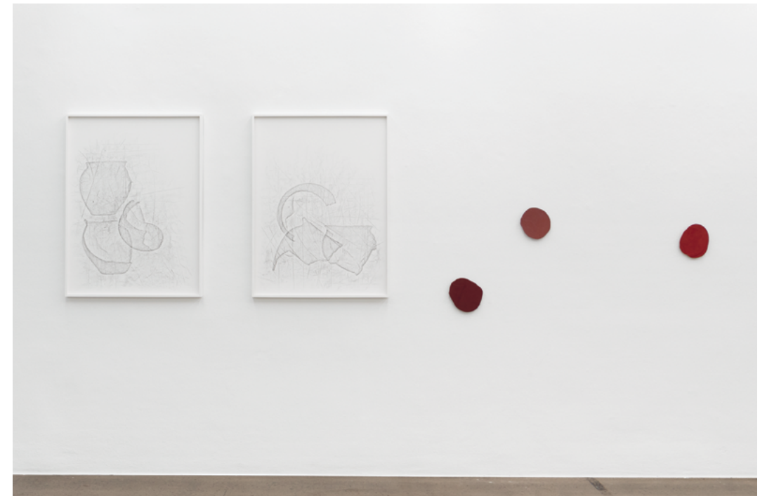
10 Scherben | Scherben , 2022 Beton und Silikatfarbe | Concrete and silicate paint 45x34cm